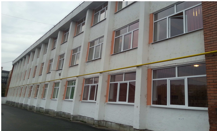
Școala Gimnazială Dacia - corp A

În anul 2013 au fost finalizate lucrările de înlocuire a tâmplăriei din lemn cu PVC la Școala Gimnazială Dacia, corpul A de pe strada Panseluțelor nr.6. Prin realizarea acestor lucrări condițiile de desfășurare a învățământului au fost considerabil îmbunătățite.