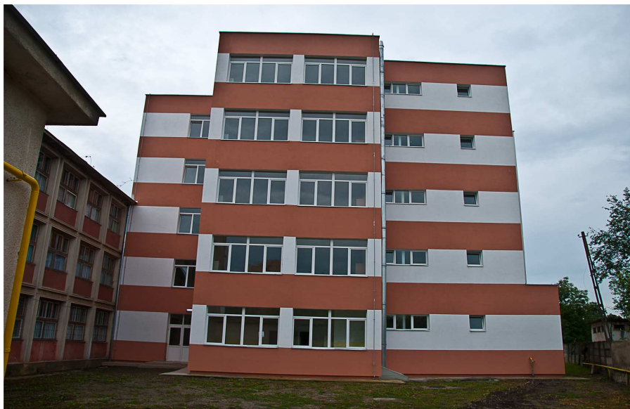
Liceul cu program Sportiv Szasz Adalbert – clasele IX-XII

În luna septembrie a anului 2013 a fost inaugurat corpul de clădire destinat Liceului cu Program Sportiv Szasz Adalbert, lucrare începută în anul 2008. Valoarea lucrării a fost de aproximativ 4.800.000 RON. Clădirea este construită în regim parter cu patru nivele, are 11 săli de clasă, centrală termică modernă și toate spațiile administrative necesare.