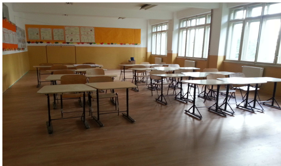
Școala Gimnazială Europa – sală de clasă

În urma deciziei de relocare a Școlii Gimnaziale Europa de la vechiul sediu de pe str. Horea nr.19-23, pe strada Victor Babeș nr.11 (clădirea în care a funcționat LPS Szasz Adalbert clasele IX-XII), au fost efectuate lucrări de reparații capitale, prin renovarea întregii clădiri, înlocuirea tâmplăriei din lemn cu PVC, rașchetarea și lăcuirea parchetului, renovarea holurilor și a grupurilor sanitare. Reabilitarea clădirii va continua cu reparația integrală a șarpantei acoperișului acestei instituții,.