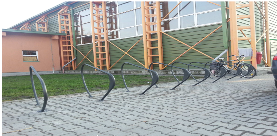
Liceul cu Program Sportiv Szasz Adalbert

În ideea promovării unui stil de viață sănătos și a încurajării activităților sportive, au fost montate la trei instituții de învățământ suporturi pentru biciclete.